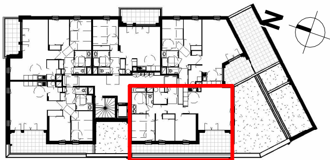
Repérage de l'appartement dans le bâtiment

COEUR D'AULPS 52 LOGEMENTS SAINT JEAN D'AULPS